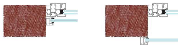
cotas en mm